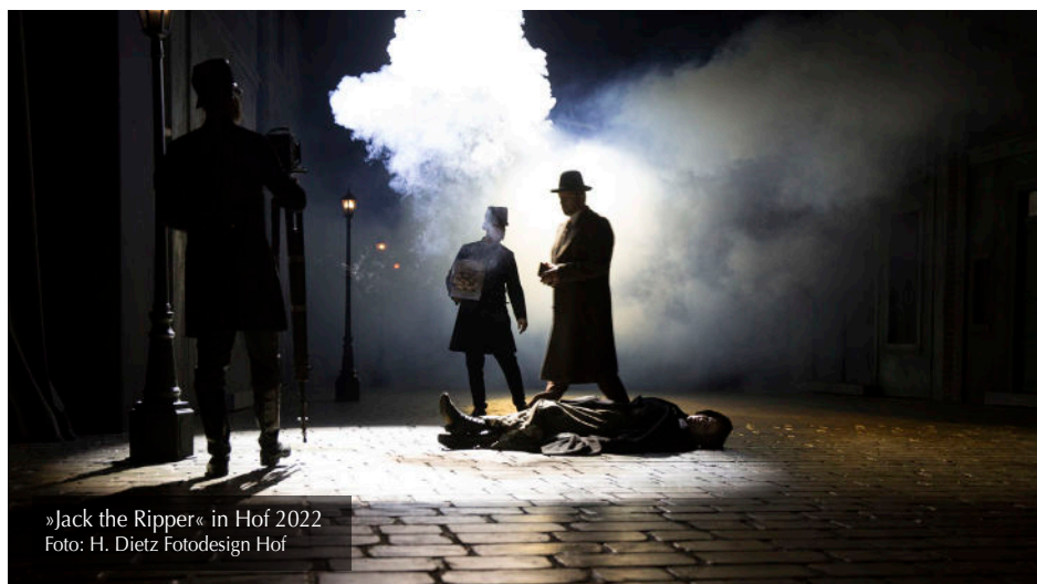
»Jack the Ripper« in Hof 2022

blimu: Die Fans und Zuschauer dürfen sich auch auf die CD zum Musical freuen, allerdings wurde diese nicht ausschließlich von denen eingesungen, die jetzt auf der Bühne zu sehen sein werden, wie kam es dazu?