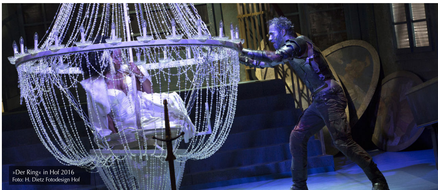
»Der Ring« in Hof 2016

FN: Ich glaube, es bröckelt, weil es einfach immer weniger Menschen gibt, die sich eine Regietheater-Operninszenierung von einem Stoff ansehen, manchmal mehrere Stunden im Neonlicht mit Aktentaschen und Alditüten, um dann frustriert oder gelangweilt aus dem Theater zu gehen. Gerade die jüngere Generation, die gar kein Bildungsbürgertum-Wissen mehr mitbekommen hat – die Schulen und das Bildungssystem sind ja nicht mehr so wie vor 30 Jahren. Teilweise hat man den Eindruck, dass die großartige Musik, gerade z.B. bei Wagner oder Mozart, wirklich nur als Tonspur mitläuft